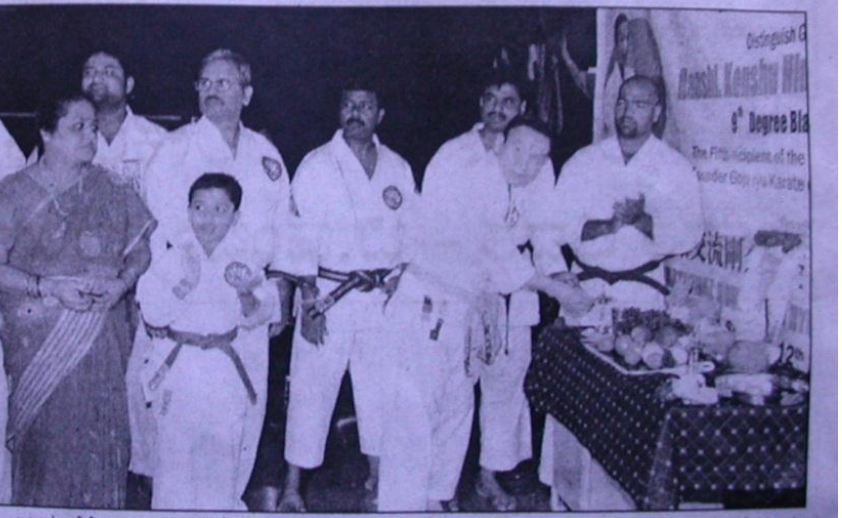
ದಾವಣಗೆರೆ, ಆ.12- ಕರಾಟೆ ಕಲೆ ಯಲ್ಲಿನ ತಪ್ಪು ತಿಳಿವಳಿಕೆ ಹೋಗಲಾಡಿ ಸುಲಭ ಇಲ್ಲಿನ ನೇತಾಜಿ ಸುಭಾಷ್ಚಂದ್ರ, ಪಾಡ, ಪಾವೇರಿ, ಬೆಂಗಳೂರು, ಲೆಯಲ್ಲಿ ಈ ಕಾರ್ಯಾಗಾರ ನಡವಲಾಗು ಹುಟ್ಟು, ಮೈಸೂರು ಇನ್ನಿತರಡೆಗಳಿಂದ ತಿದ್ದಿ ಎಂದರು.